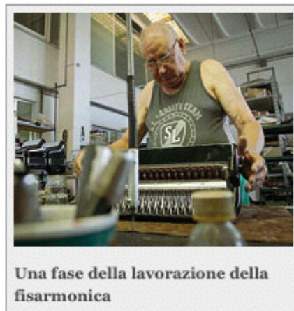
Una fase della lavorazione della fisarmonica