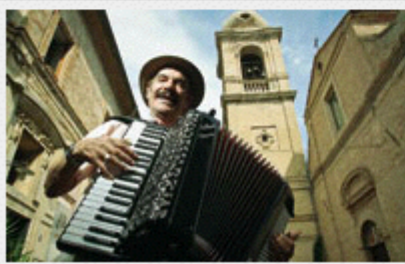
Un suonatore di fisarmonica per le vie di Castelfidardo

Castelfidardo si riorganizza per sfidare l'Asia, 18 mila strumenti su misura l'anno. Ma i giovani disertano