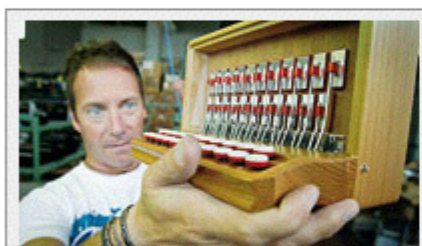
Una fase della lavorazione della fisarmonica